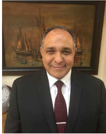
اللواء طيار طارق فوزى