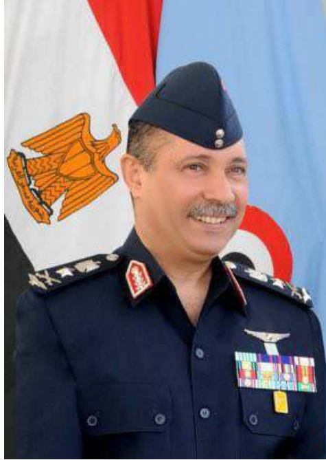
الفريق / يونس المصري وزير الطيران المدني