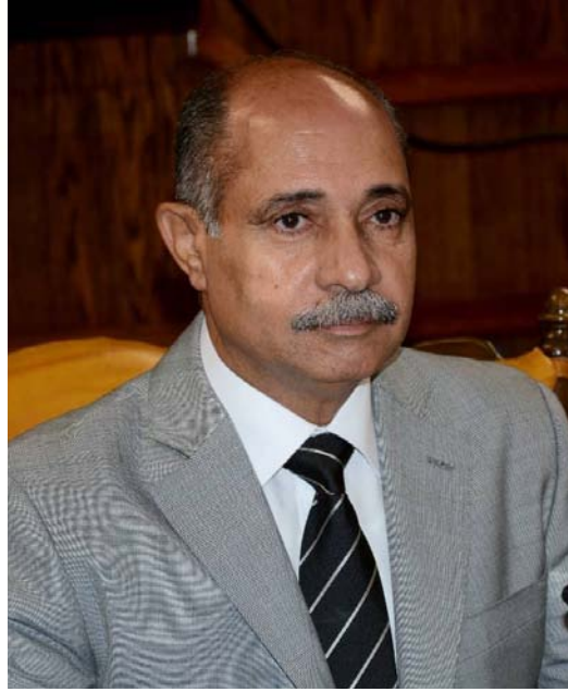
الفريق/ يونس المصري وزير الطيران المدني